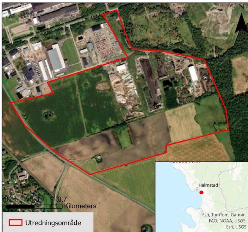
Figur 1. Geografisk placering av Kistinge industriområde södra – del av Fyllinge 20:393 m.fl.