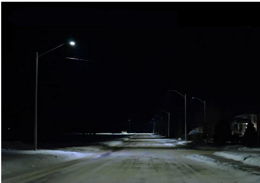
Figur 1. Exempel på gatlampor som har minimal spridning utanför det nödvändiga området.

Exploatering av olika slag kan sannolikt få en negativ effekt på fladdermusfaunan om tillgången på betydelsefulla habitat, så som: viloplatser, övervintringsplatser och bomiljöer minskar i området. Detta på grund av avverkning, ny placerad/utökad belysning och generellt försämrade livsmiljöer. Om kolonier av fladdermusarter, som är sällsynta i landskapet eller som har små lokala populationer påverkas, kan påtagliga effekter uppkomma både ur ett lokalt och