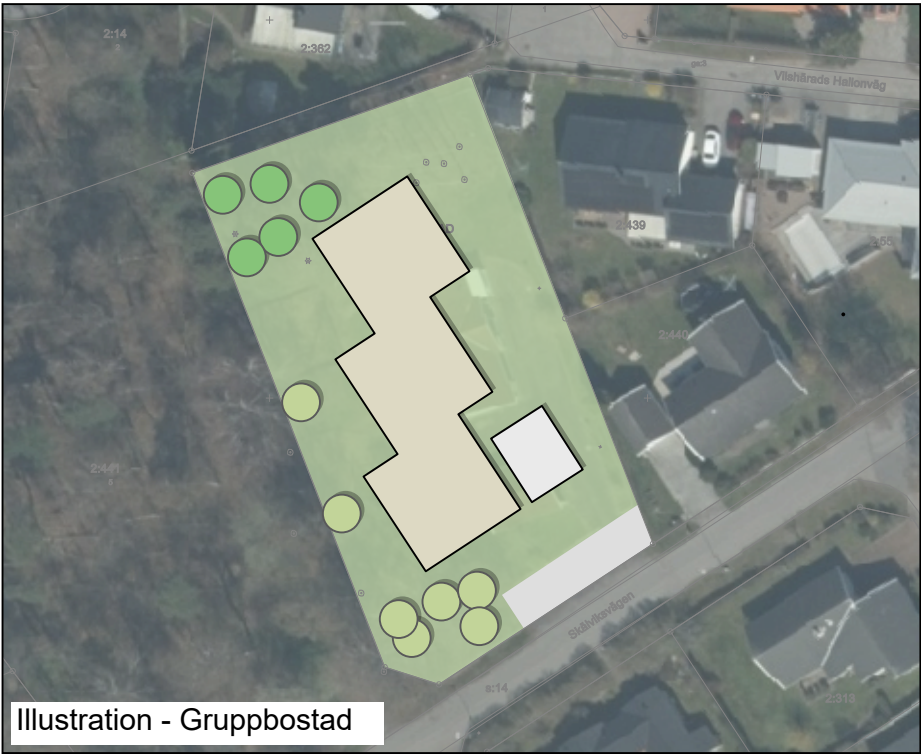
Illustration - Gruppbofastad

Genomförandetiden är 5 år från det datum detaljplanen vinner laga kraft.