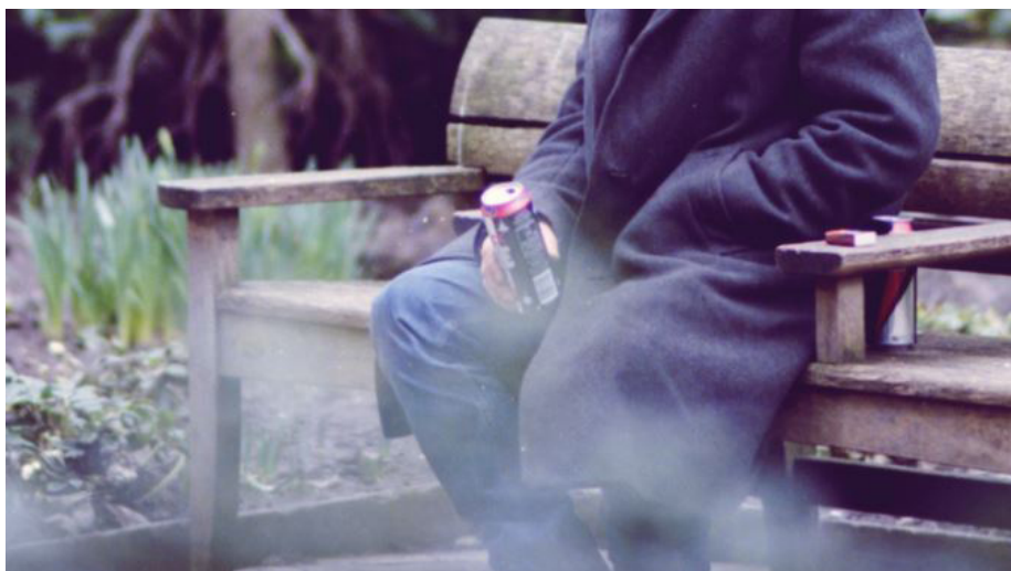
Hemlösheten beskriver inte en person utan den situation som en person befinner sig i

Arbete mot hemlöshet behöver bestå av en mängd olika insatser eftersom hemlöshet kan ha så många olika orsaker. För någon började problemen med arbetslöshet och ekonomiska problem för någon annan med missbruk eller psykisk ohälsa. Inte sällan består problembilden av flera av dessa orsaker. Dessutom innebär bara det faktum att vara utan bostad ett stort psykiskt och fysiskt lidande.