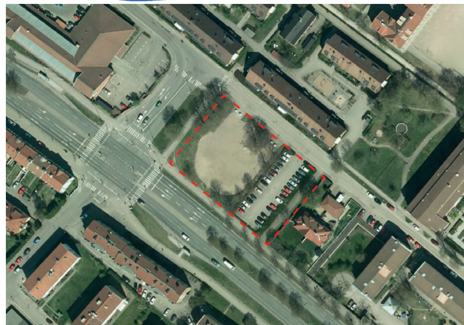
Dnr KS 2012/0506

Lasse Sabell, planarkitekt, 035-13 98 27, lasse.sabell@halmstad.se eller Biträdande planarkitekt: Charlotte Örnbring planarkitekt, 035-13 72 18, charlotte.ornbring@halmstad.se