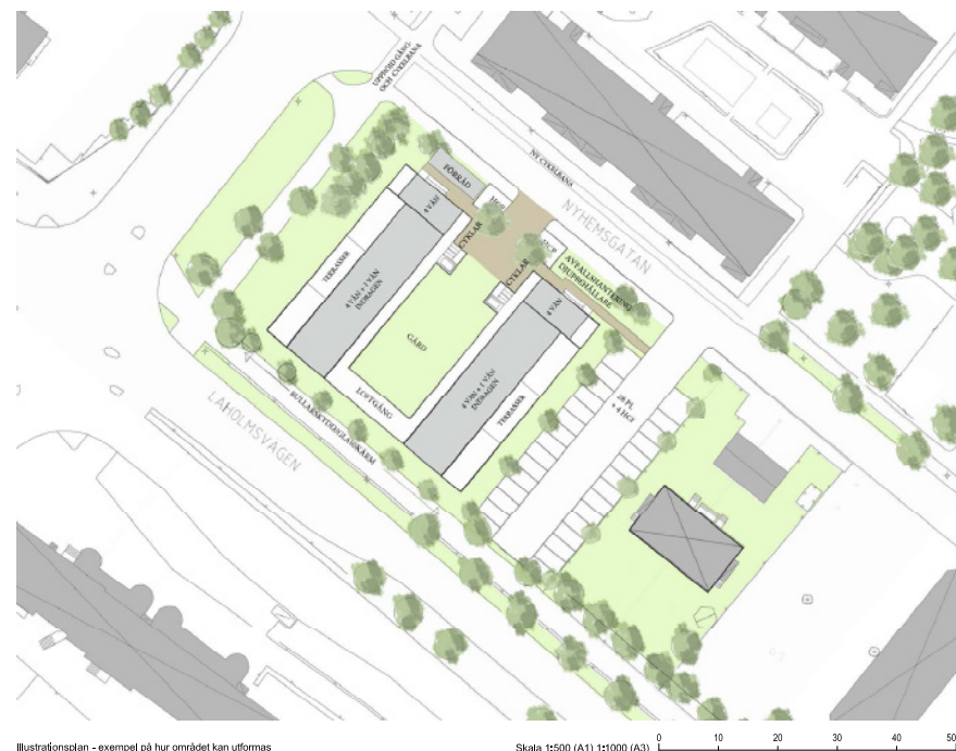
Illustrationsplan - exempel på hur området kan utformas

Detaljplaneförslaget följer intentionerna i gällande översiktsplan för Halmstads kommun.