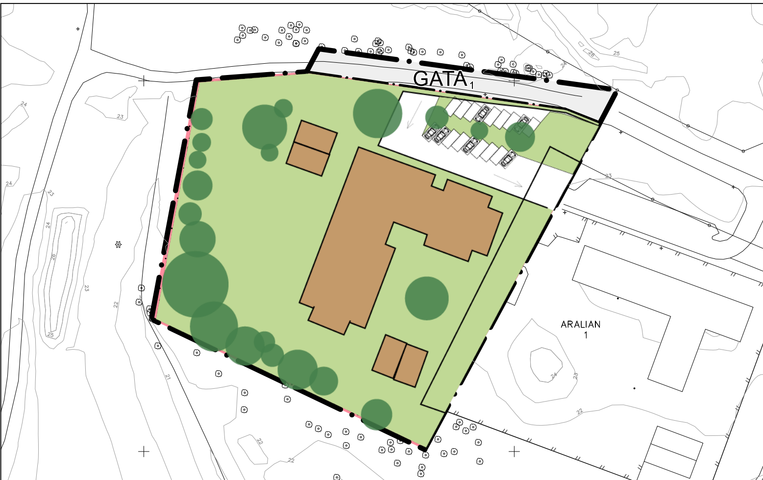
Skala 1:1000 (A3)