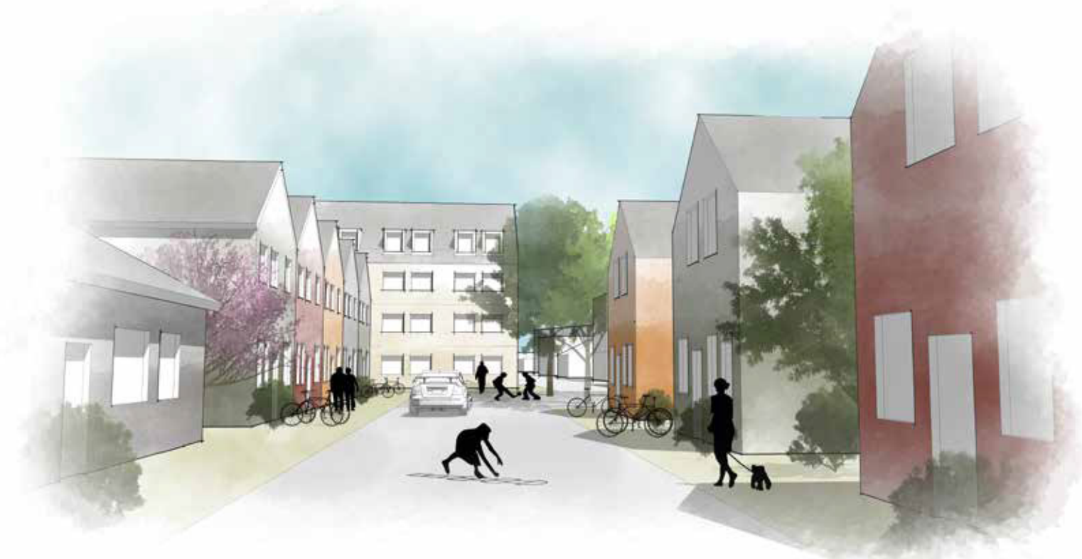
Gårdsgata med en blandning av radhus, villor och flerbostadshus i olika skalor.