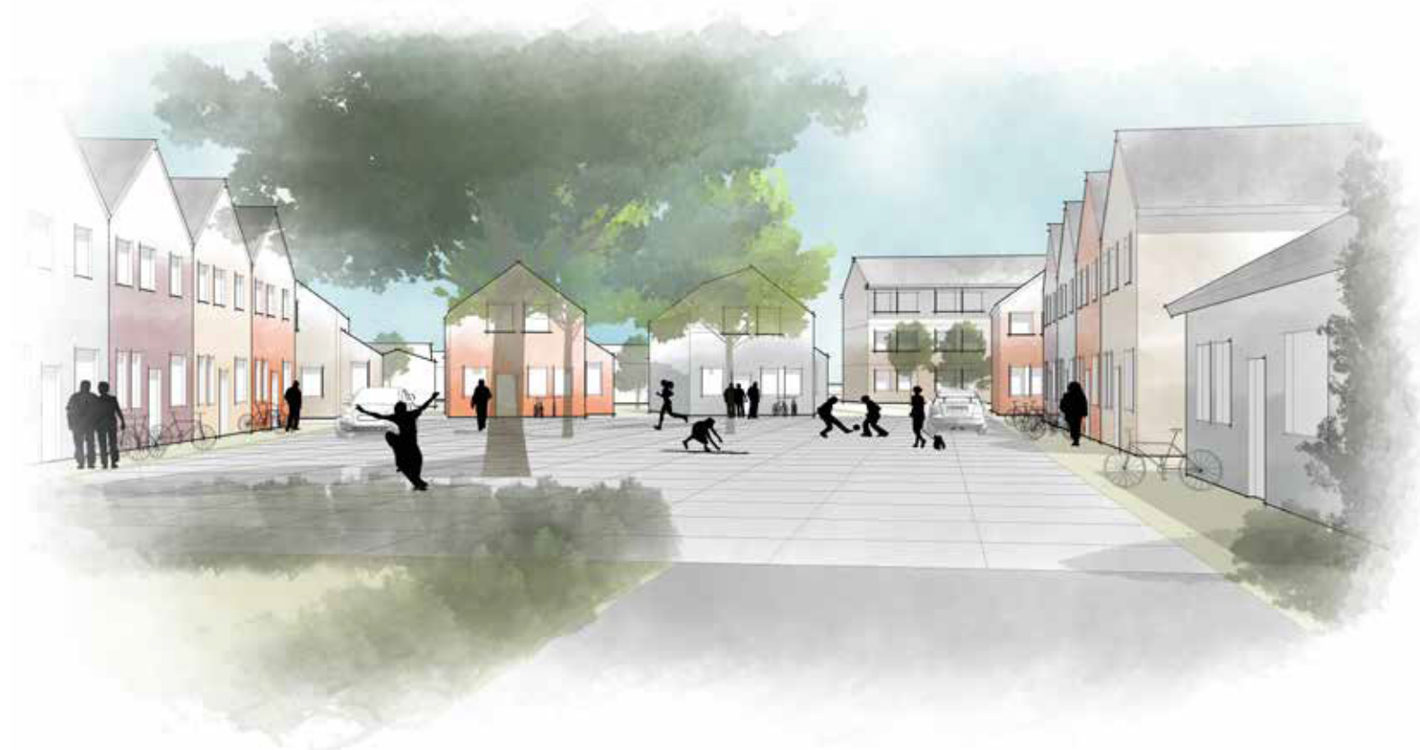
Öppen plats i sydöstra delen av området.