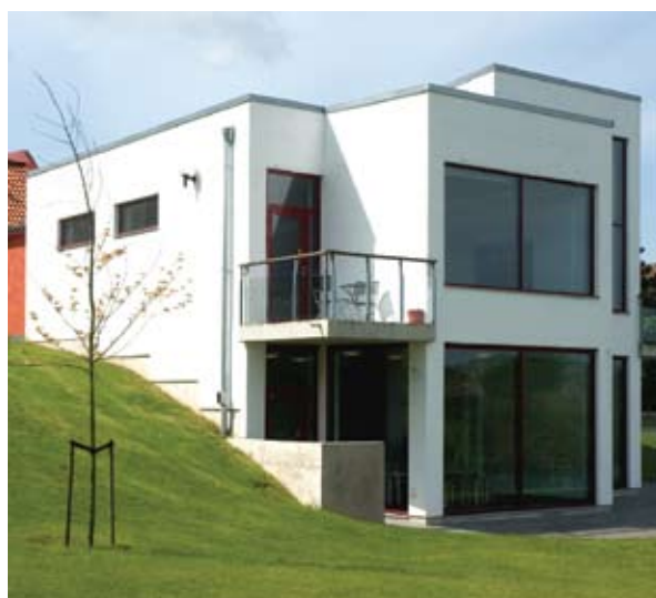
Teckningsmuseet i Laholm