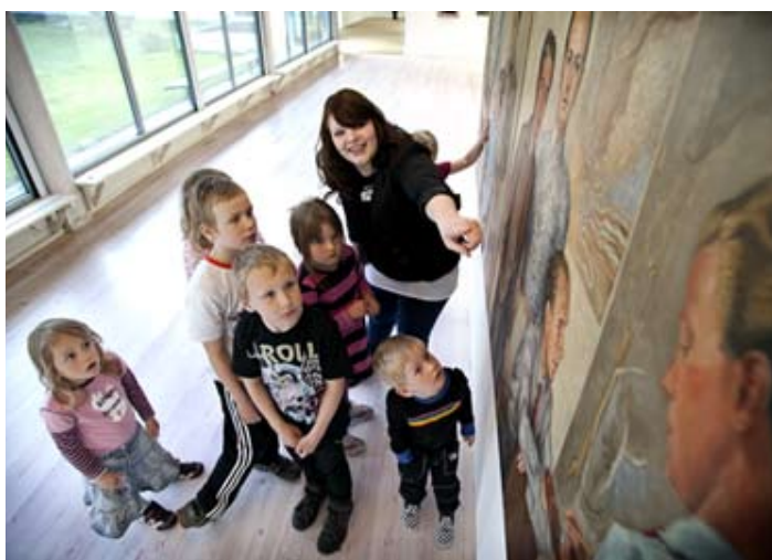
Visning på Mjellby Konstmuseum