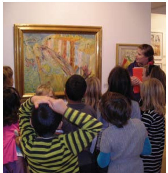
Bildjakt på Hallands Konstmuseum