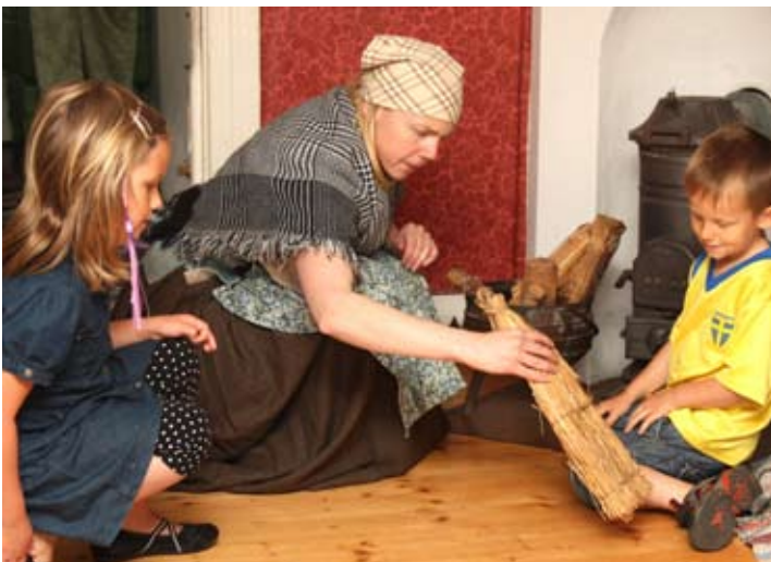
Barnen provar på några av frun Johanna på Hindströmsgårdens sysslor

Kontaktperson för bokning: Josefin Andersdotter, tel 035 16 23 00. Kontaktperson för pedagogiskt program: Evelina Lindblom (konst), tel 035 16 23 14, epost evelina.lindblom@hallandskonstmuseum.se och Johan Dahnberg (kulturhistoria), tel 035 16 23 16, epost johan.dahnberg@hallandskonstmuseum.se , www.hallandskonstmuseum.se