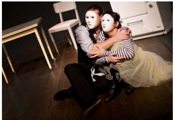
Ur föreställningen Spisa Strindberg på Teater Halland