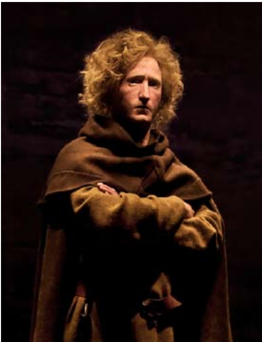
Bockstensmannen på Hallands kulturhistoriska museum